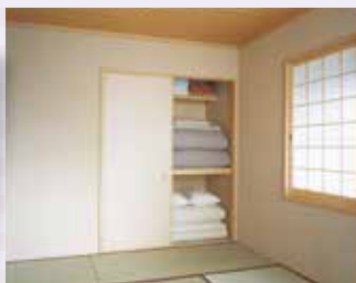
※画像には一部オプションが含まれています。

テクノストラクチャー「しつど番」 「珪藻土」を配合した壁材を採用。優れた吸放湿性能で、大切な寝具や衣類をカビやダニから守ります。