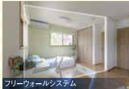
フリーウォールシステム