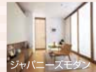
ジャパニーズモダン