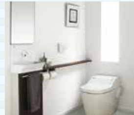
トイレ/アラウーノSII