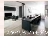
スタイリッシュモダン