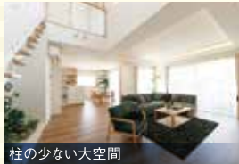
柱の少ない大空間

388項目※の緻密な構造計算で耐震性・耐久性をシミュレーション ※多雪区域は440項目。