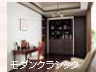
モダンクラシック