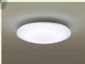
パナソニック「LED照明」

約40,000時間の長寿命※で、省エネに貢献し、電気代もお得に。リモコンで簡単に調光・調色することで、お部屋を快適に演出できます。