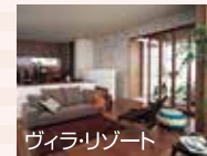
ヴィラ・リゾート